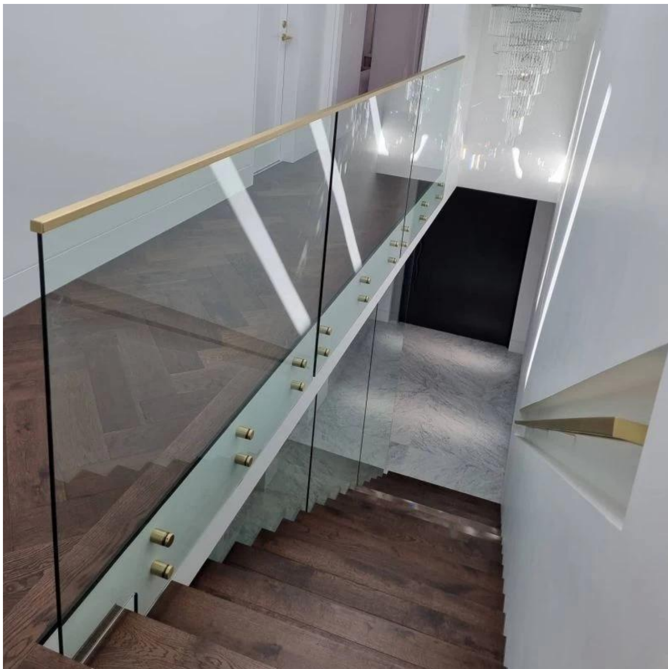
4) Glas Standoff + Top Slotted Leuning in zwarte kleur.