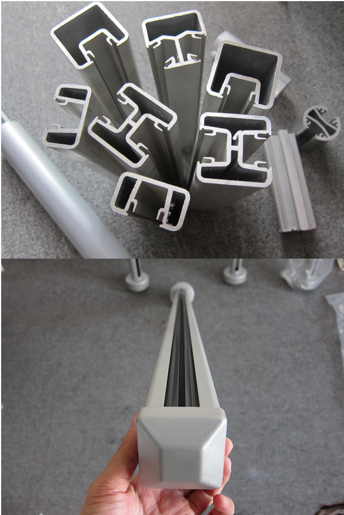
3) Aluminium leuning tekening