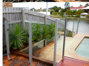
Aluminium glazen hekwerk balkon glazen balustrade kunststof aluminium bericht