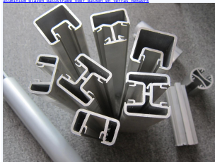
Ronde aluminium post voor een frameleze glazen balustrade project

Hier zijn tekeningen van de verschillende manieren van het Vierkante vorm halve frameleze zweembad hekwerk railing aluminium post: Richting: Een manier enkele bericht; Twee richtingen 60 graden bericht; Twee richtingen 135 graden bericht; Twee richtingen 180 graden bericht; Twee richtingen 225 graden bericht; Aluminium glazen balustrade voor balkon en terras hekwerk