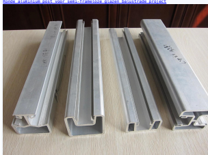
Aluminium glazen balustrade met aluminium post voor zwembad