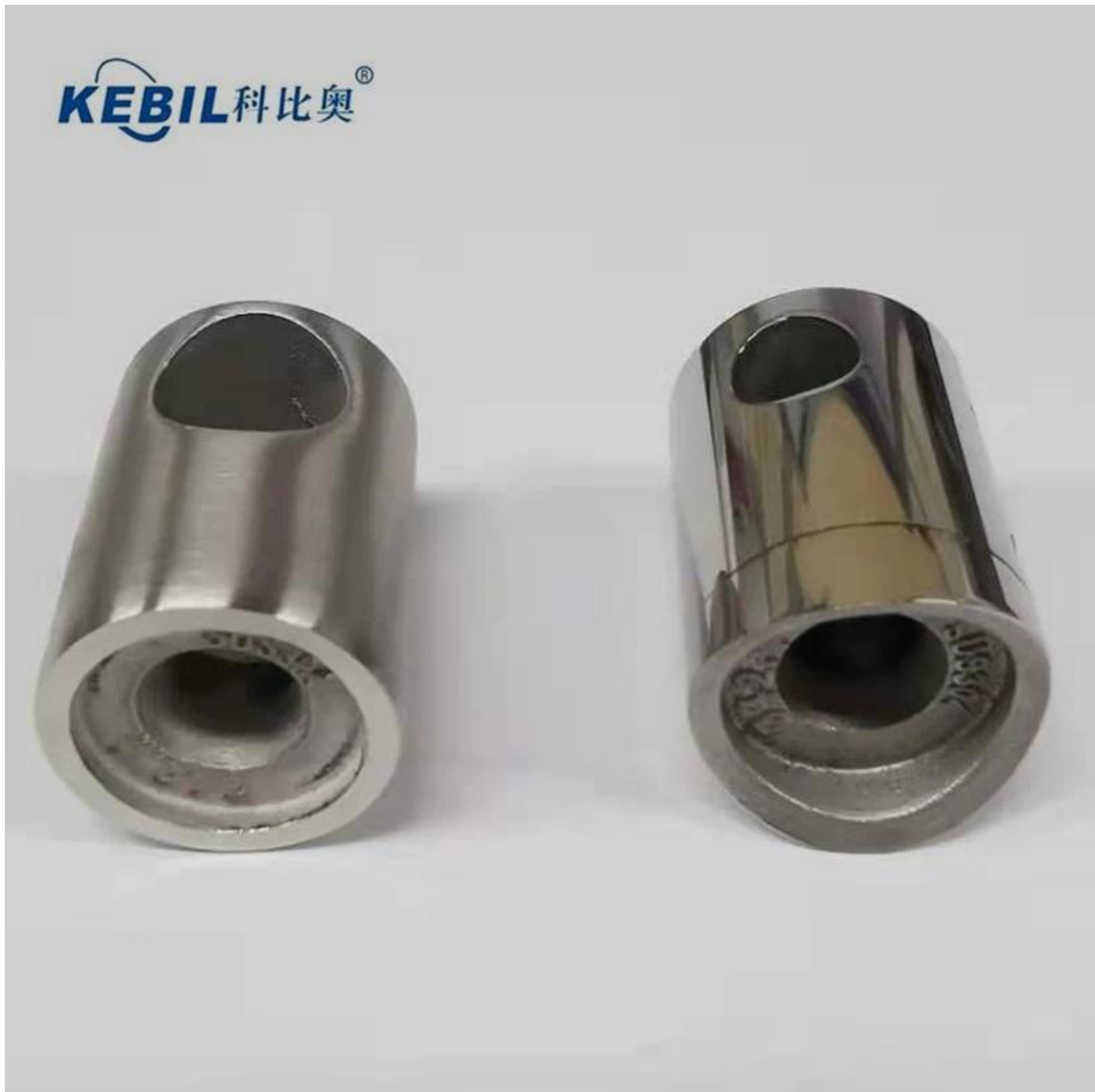
2. Verschillend Grootte Ontwerp voor Roestvrijstalen dwarsbalkhouder bar connector