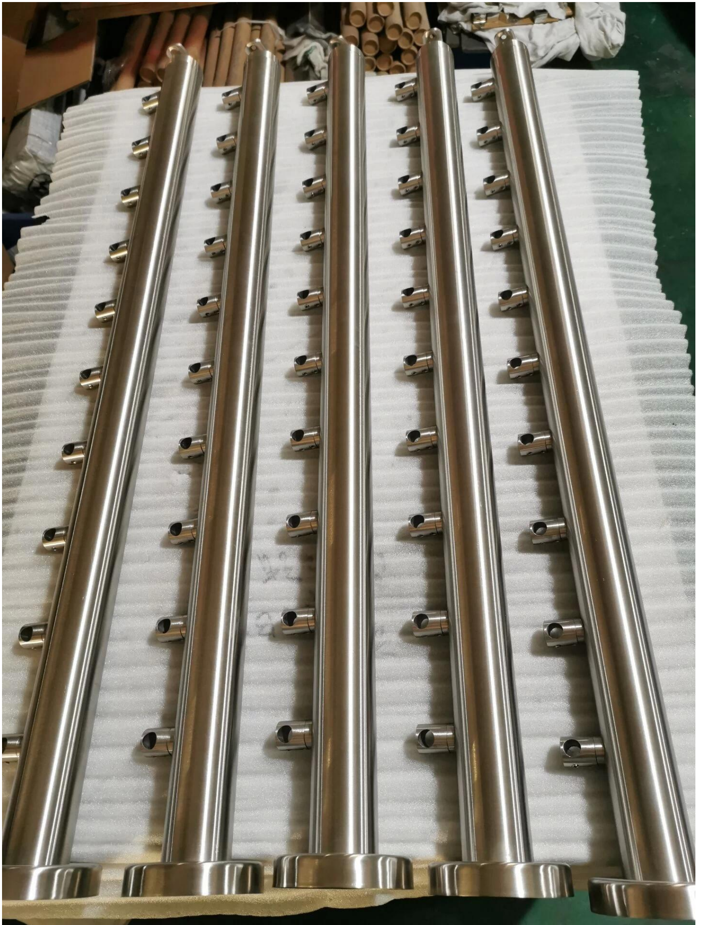
5. Verschillende afwerking voor Roestvrijstalen dwarsbalkhouder bar connector