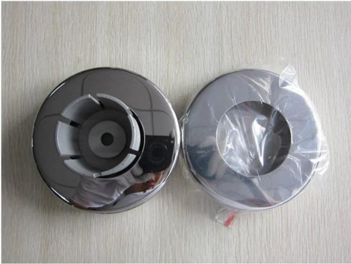
base and cover BS911