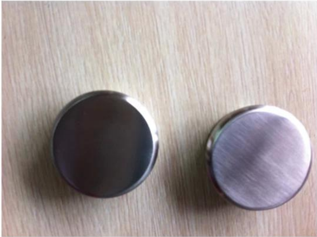
stainless steel end cap