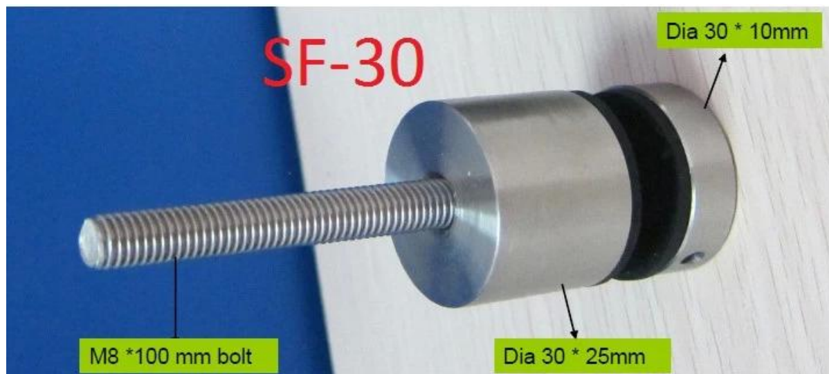
RVS 316 soort patstelling Lag schroef.