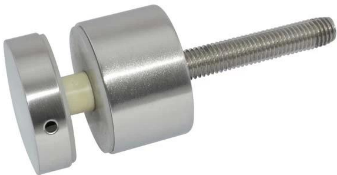
Foto van 50mm diameter glas standoff pin hout mount