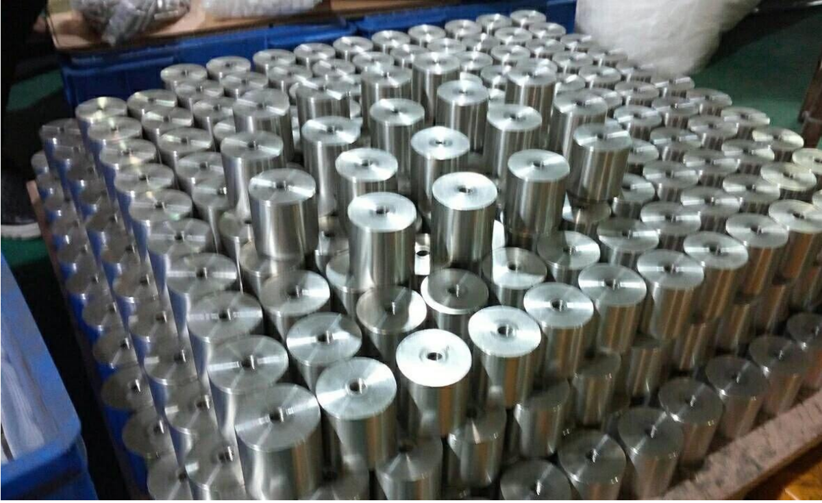
Geïnstalleerd met draadstang: