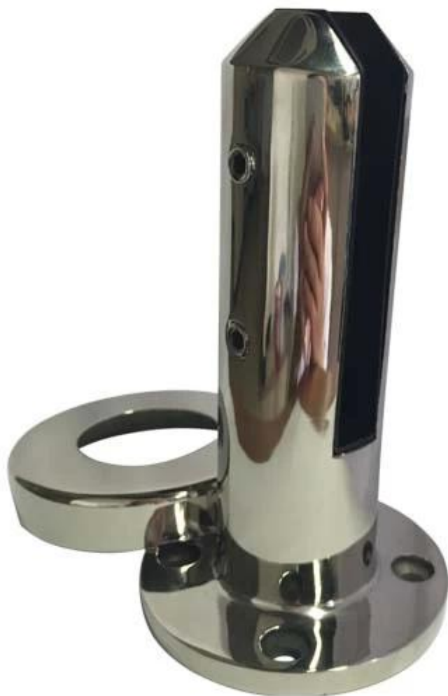
Project foto 's