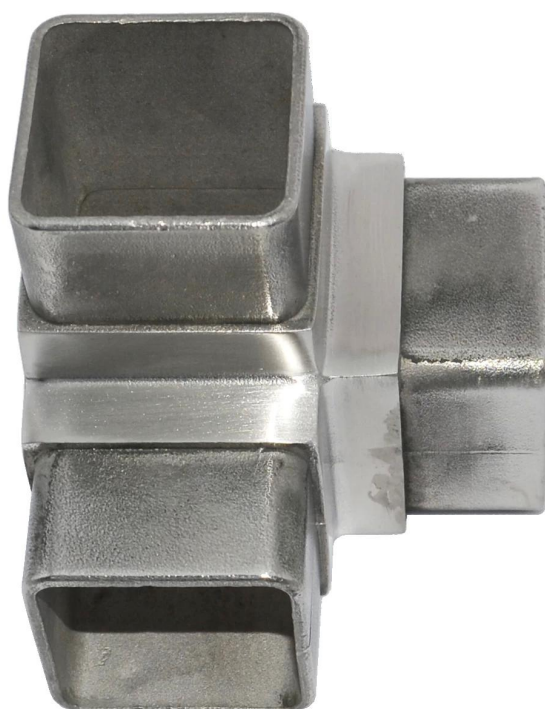
4 manier vierkante connector S404