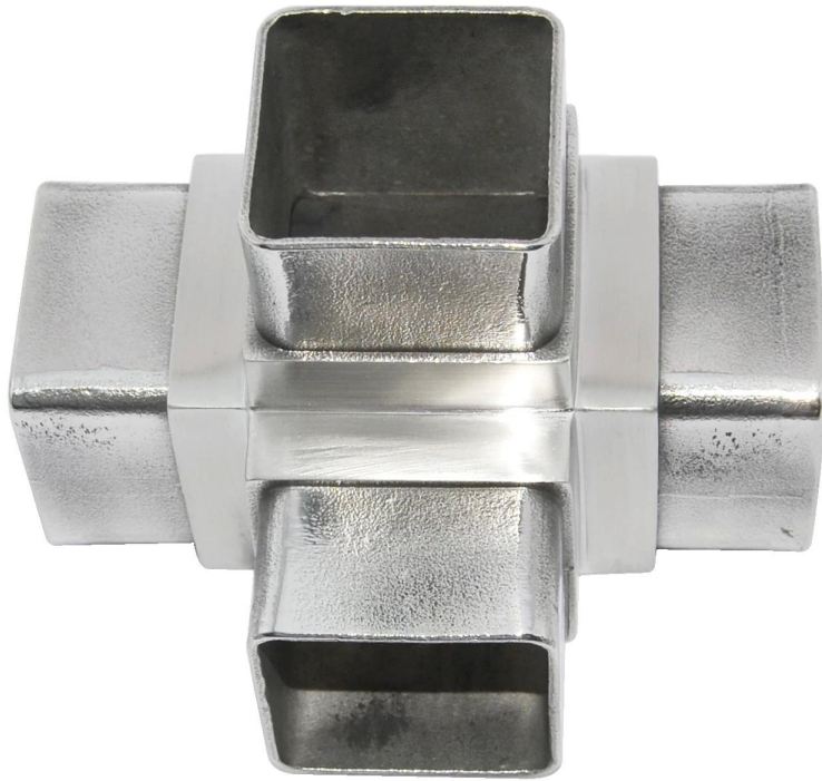
4 manier vierkante connectorS405