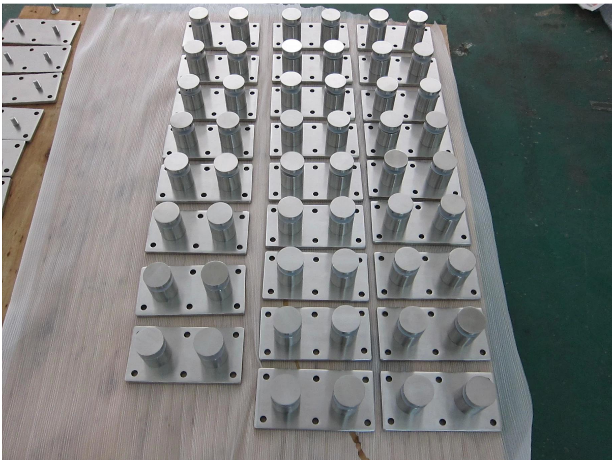
4. roestvrij staal glas standoff balkon reling ontwerpen project foto's: