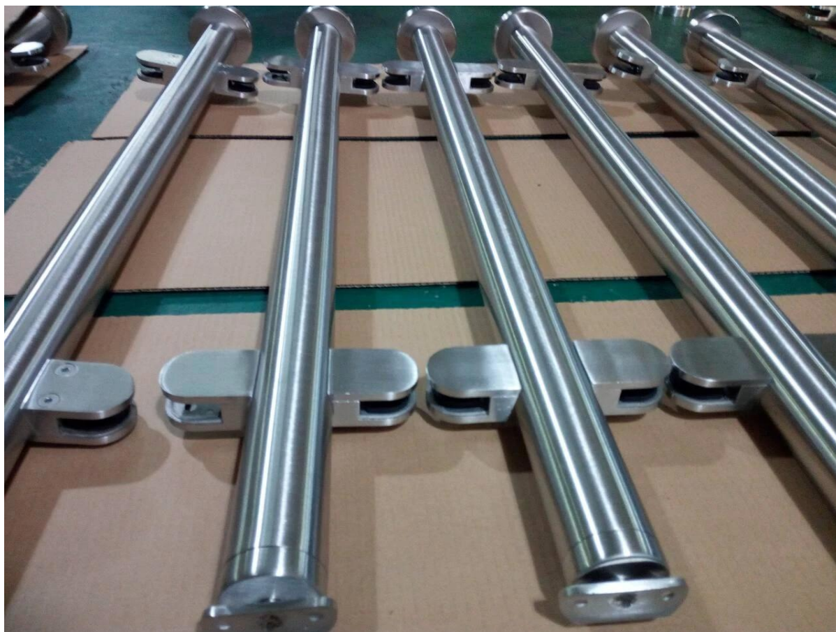
2-weg post 90 ° of hoekpaal,