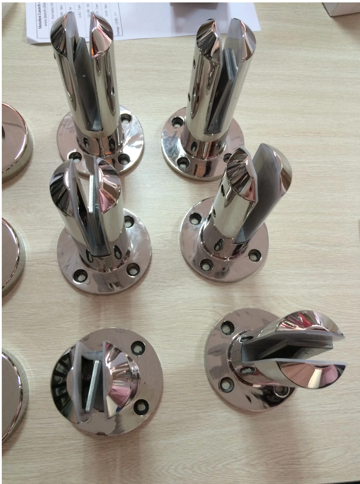
3). Rond bodemplaat spon verpakking foto.