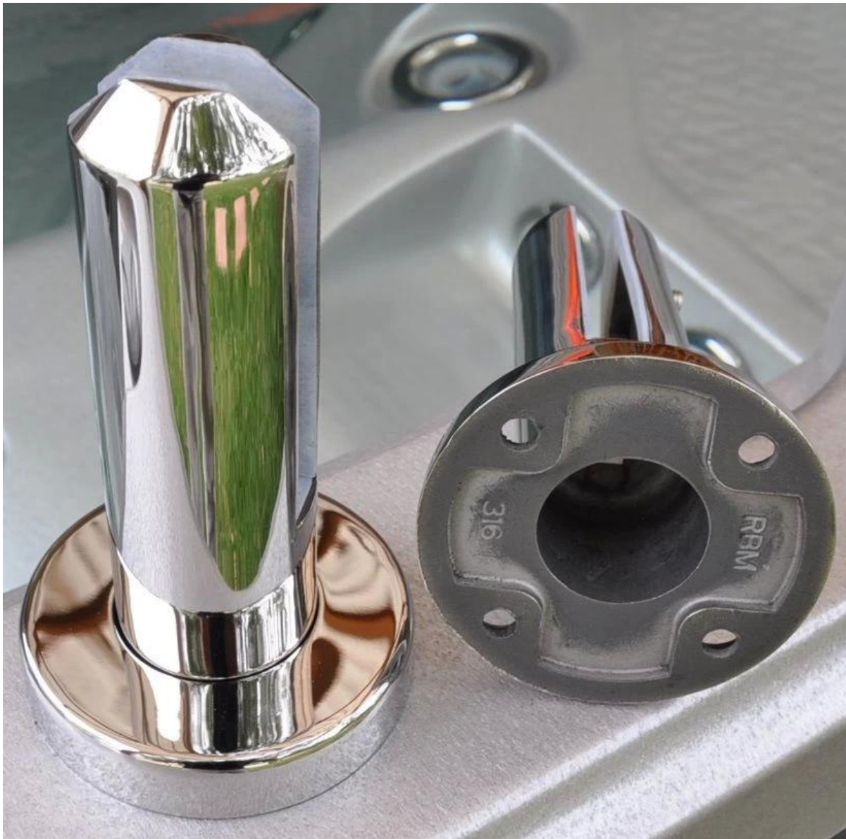
2). Rond bodemplaat spon massa goederen foto.