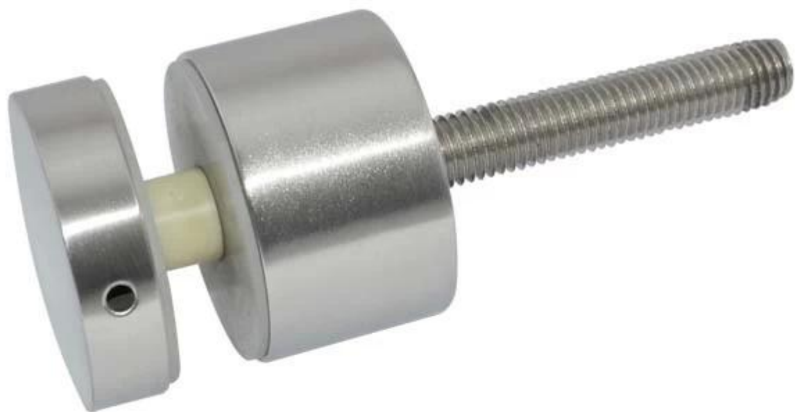
Zdjęcie szkła patowa uchwyt montażowy drewna