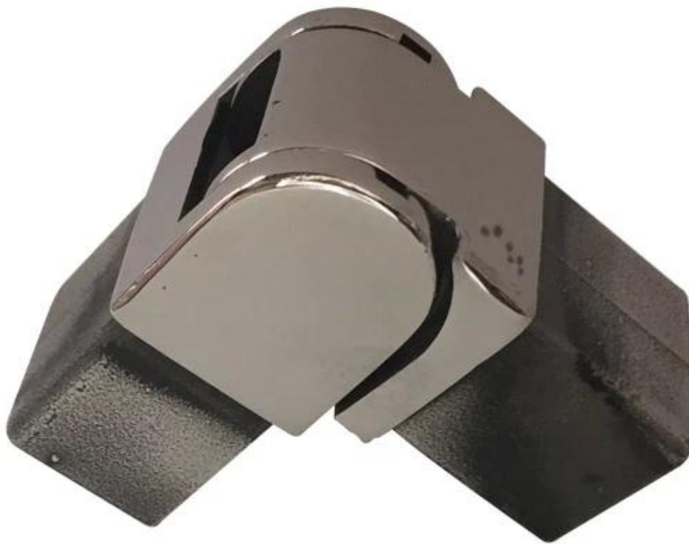
Okragły typu Górne szyny balustrady :