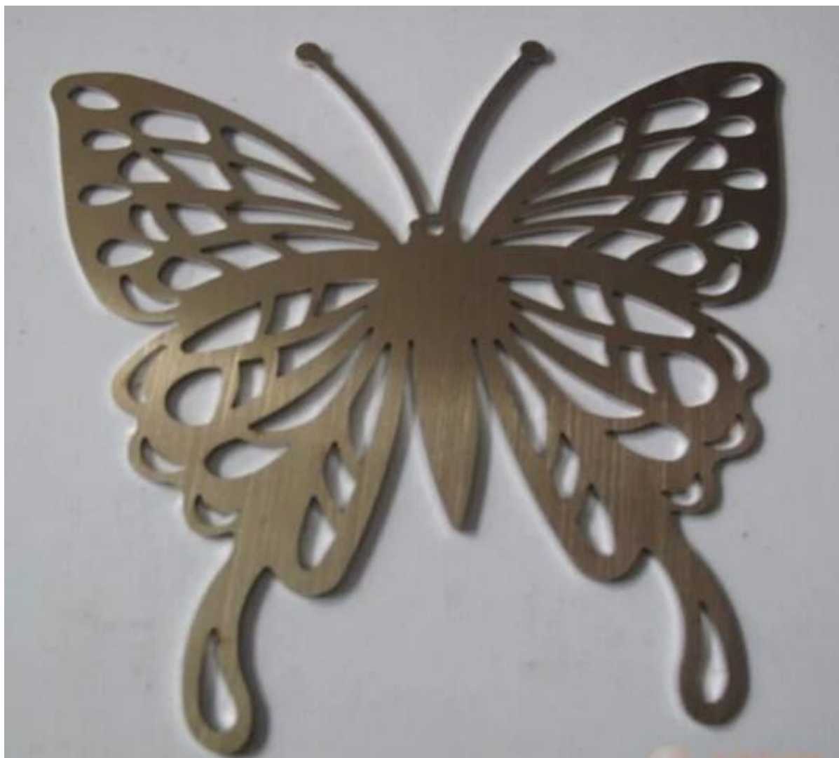
Fabryki i obróbka;