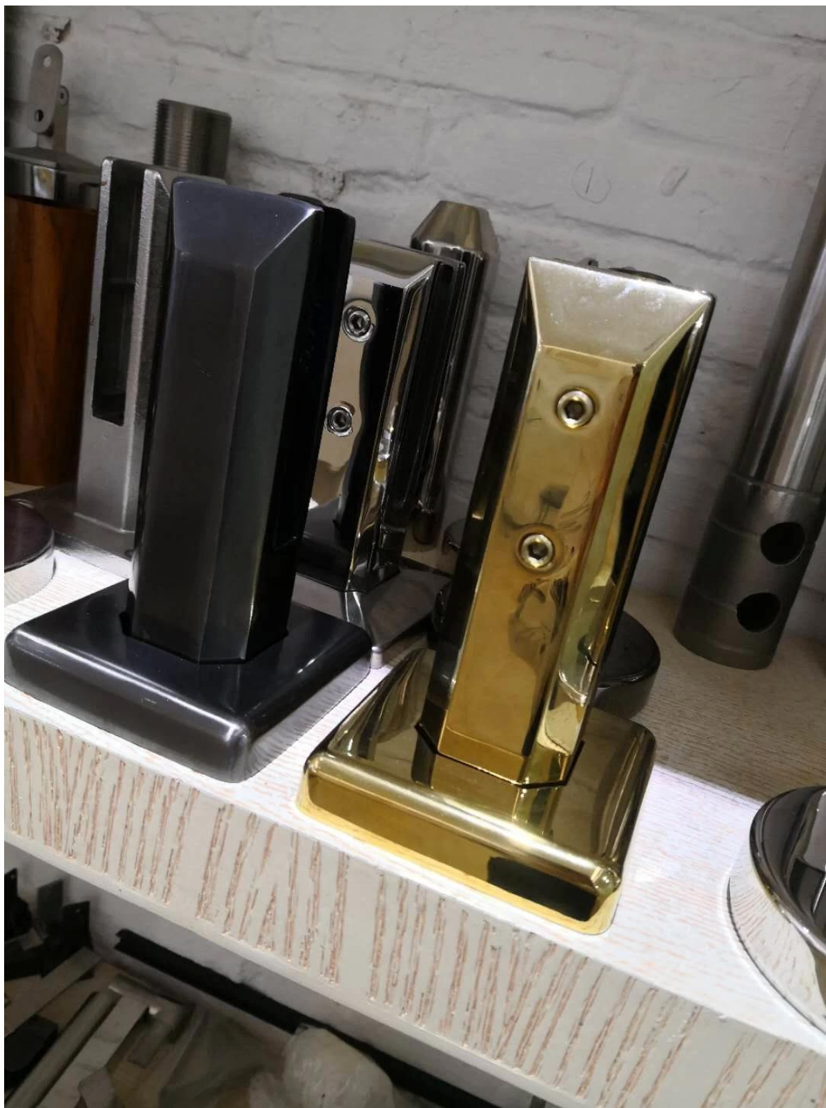
3). Rysunek dla czarnego ogrodzenia basenu ze stali nierdzewnej, SBM