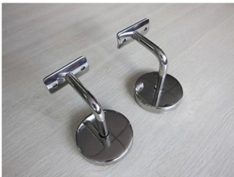
handrail bracket P703R