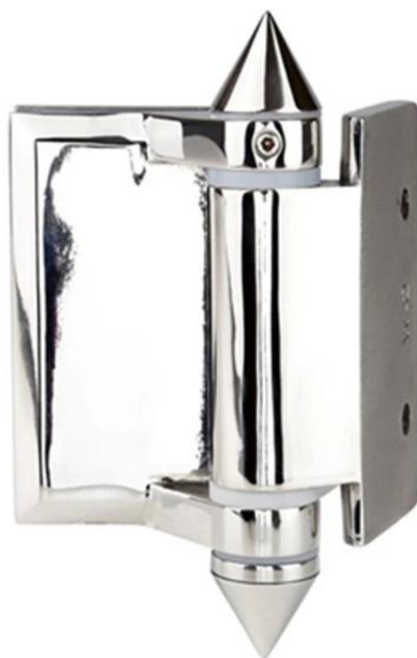
Zawias szklany do kwadratowego słupka/zawiasu ściennego, G-W, czarna powłoka proszkowa