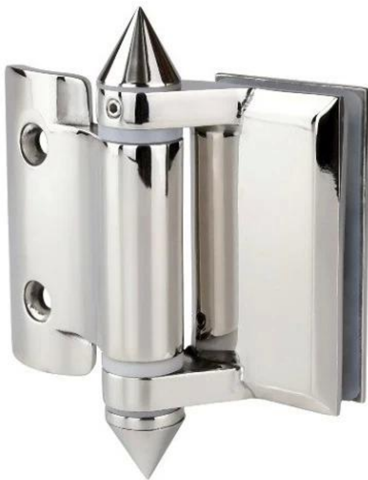
Zawias od szkła do okrągłego słupka, ze stożkowym kapturkiem na końcach