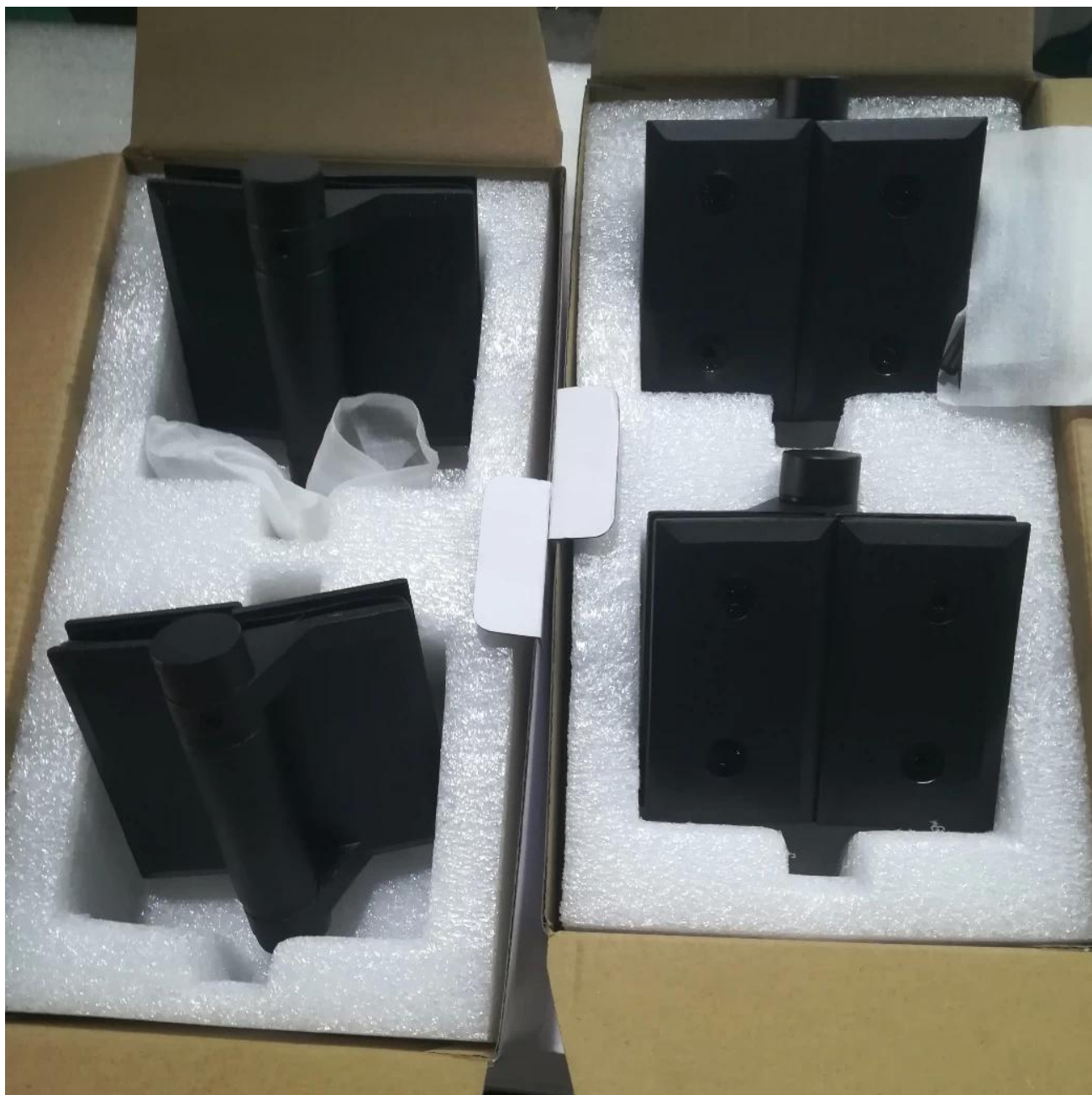
Zawias od szkła do okrągłego słupka, G-R, z płaską zatyczką na końcach