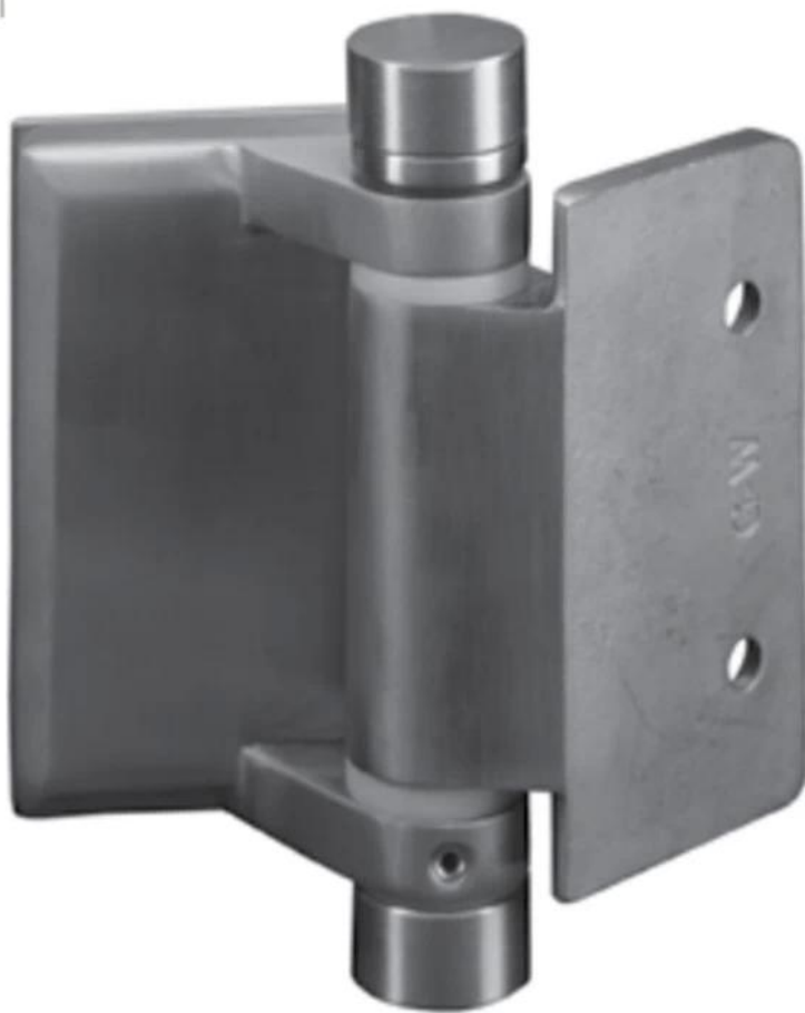
Zawias szklany do kwadratowego słupka/zawiasu ściennego, G-W, ze stożkową nasadką na końcach