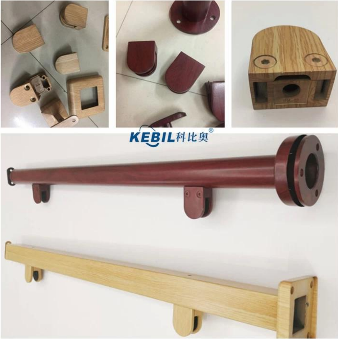
Inne produkty ze stali nierdzewnej zabarwiamy