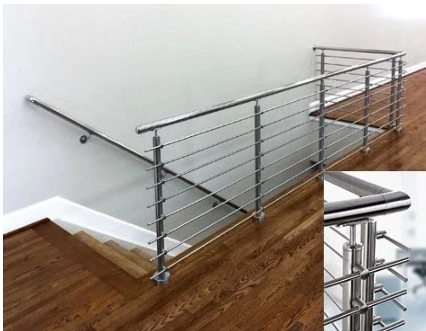
Górna / boczna konstrukcja słupka balustrady poprzecznej: