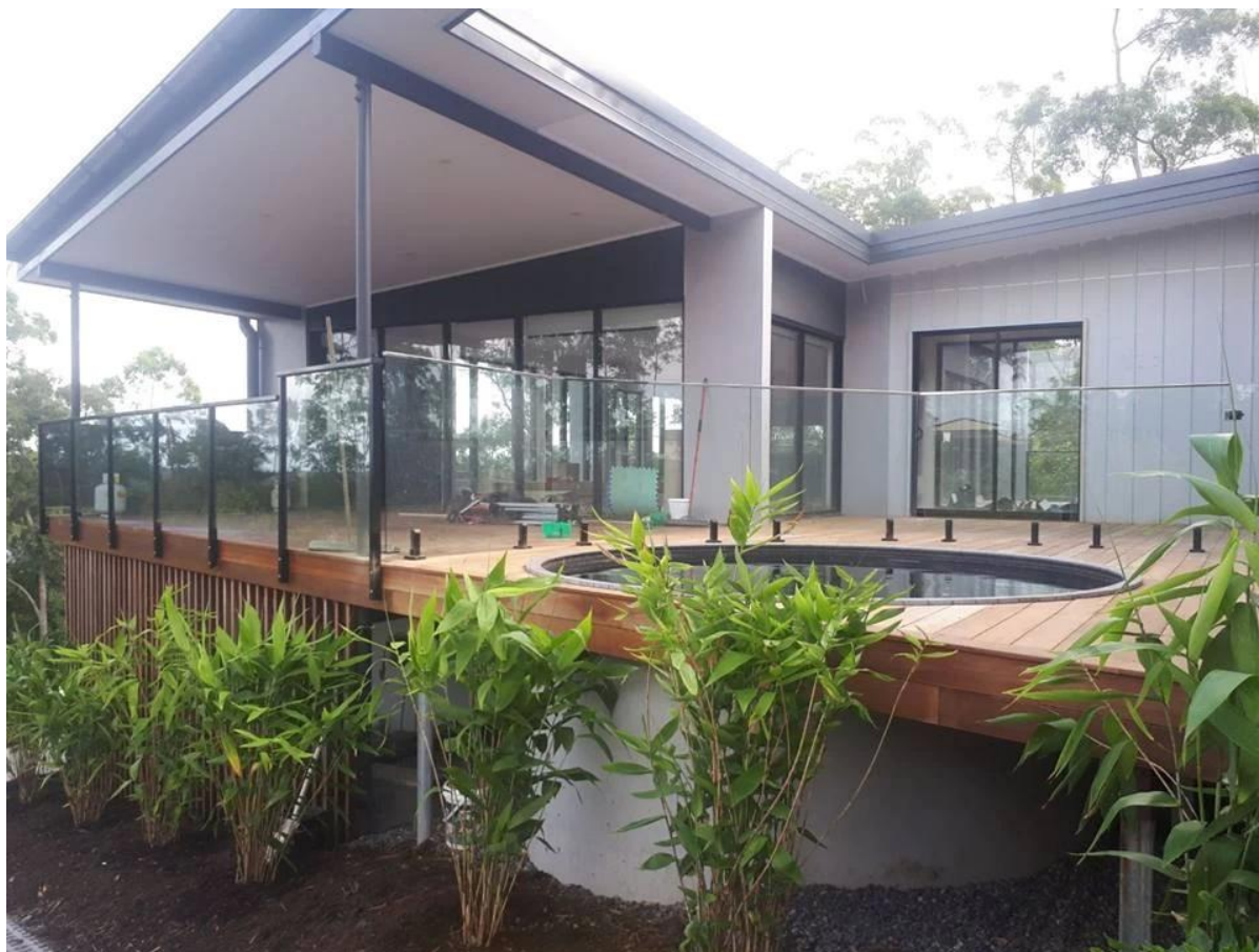
Satin Brushed Zacisk do ogrodzenia ze stali nierdzewnej Basen szklany Czop ogrodzenia SBM-3: