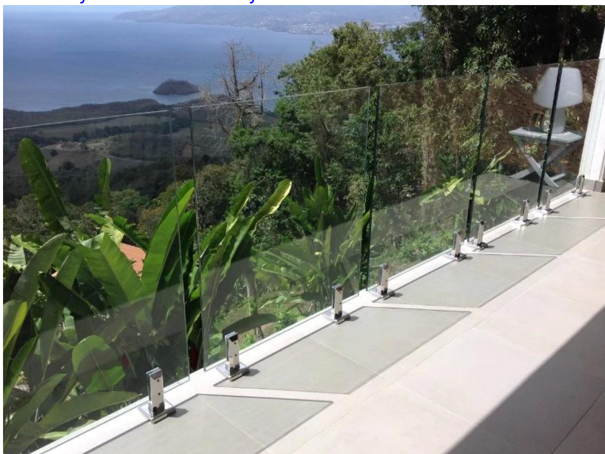
SBM w wykończeniu satynowym: