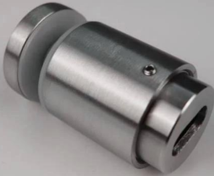
Model nr: SF-50T