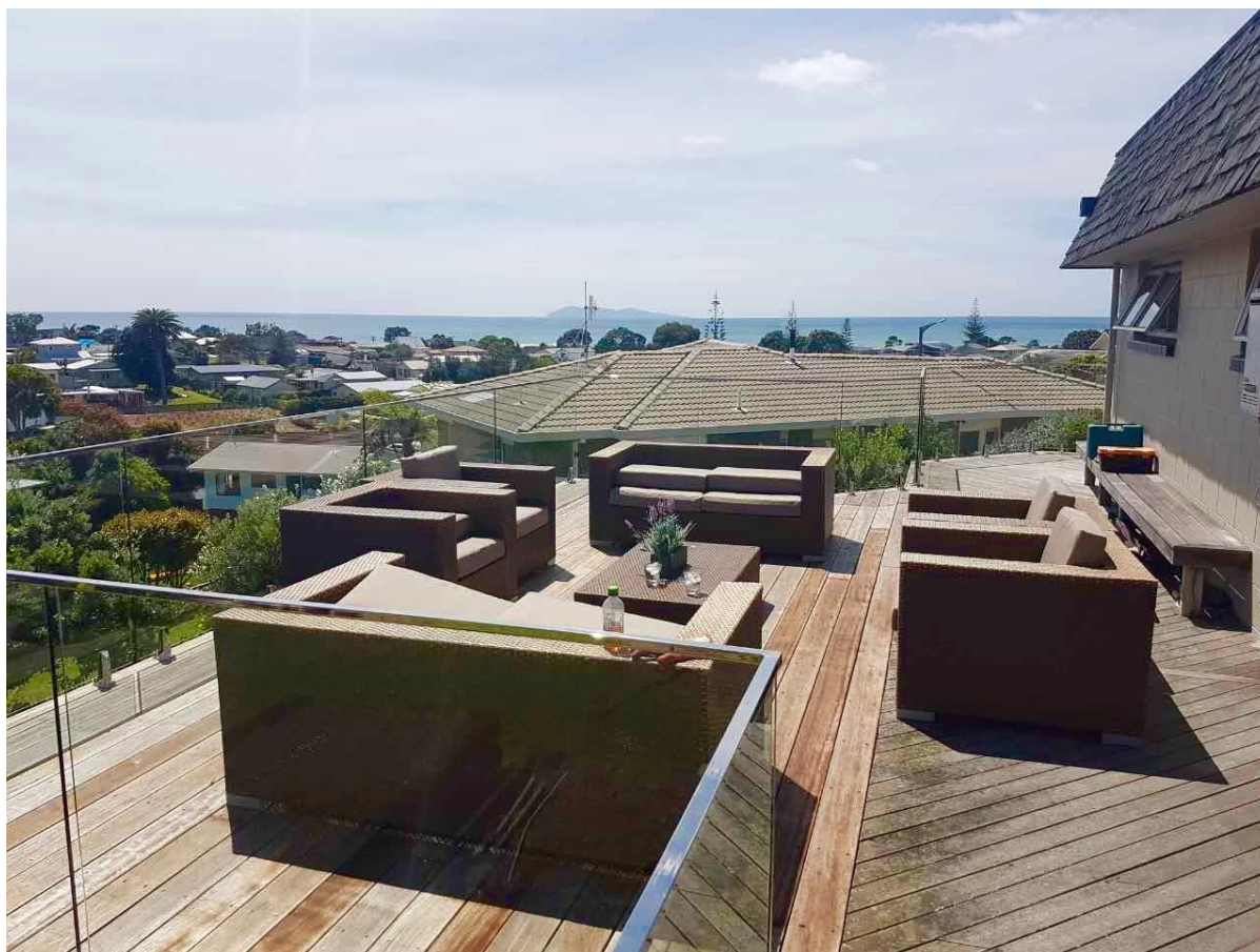
2) kryty dzienny nowoczesny ozdobne balustrady stalowe