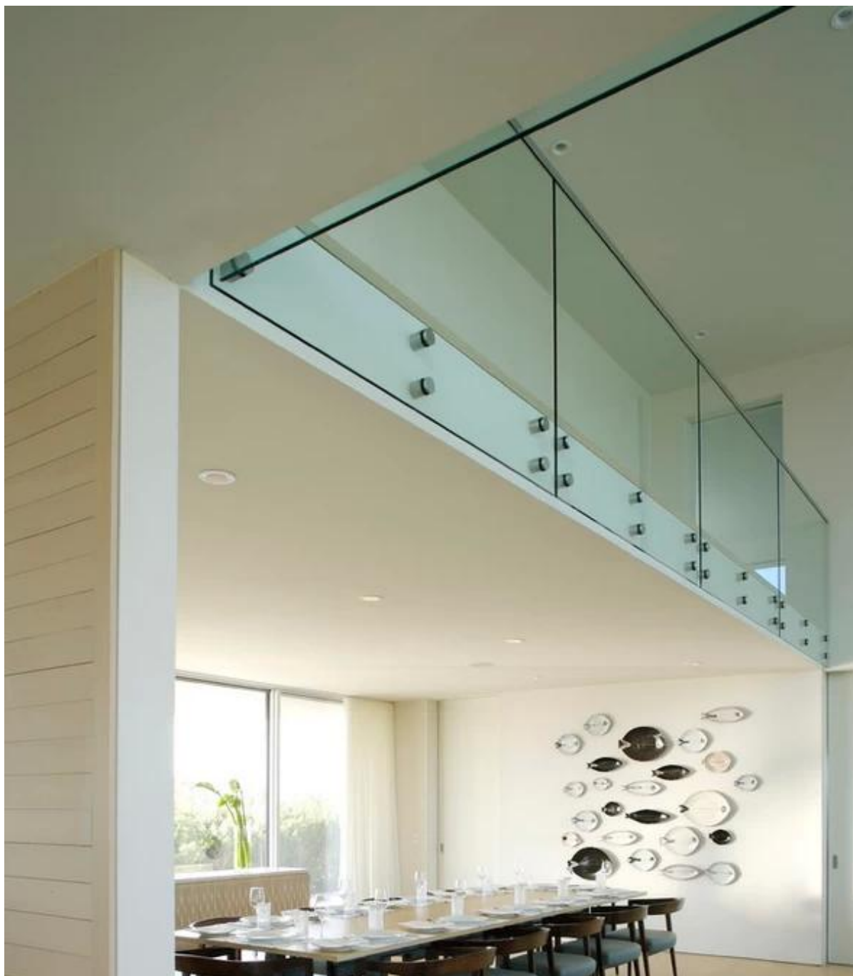
4. szklana balustrada Model No.SF-50T Szkło patowa: javascript: void (0); / * 1469851036100 */