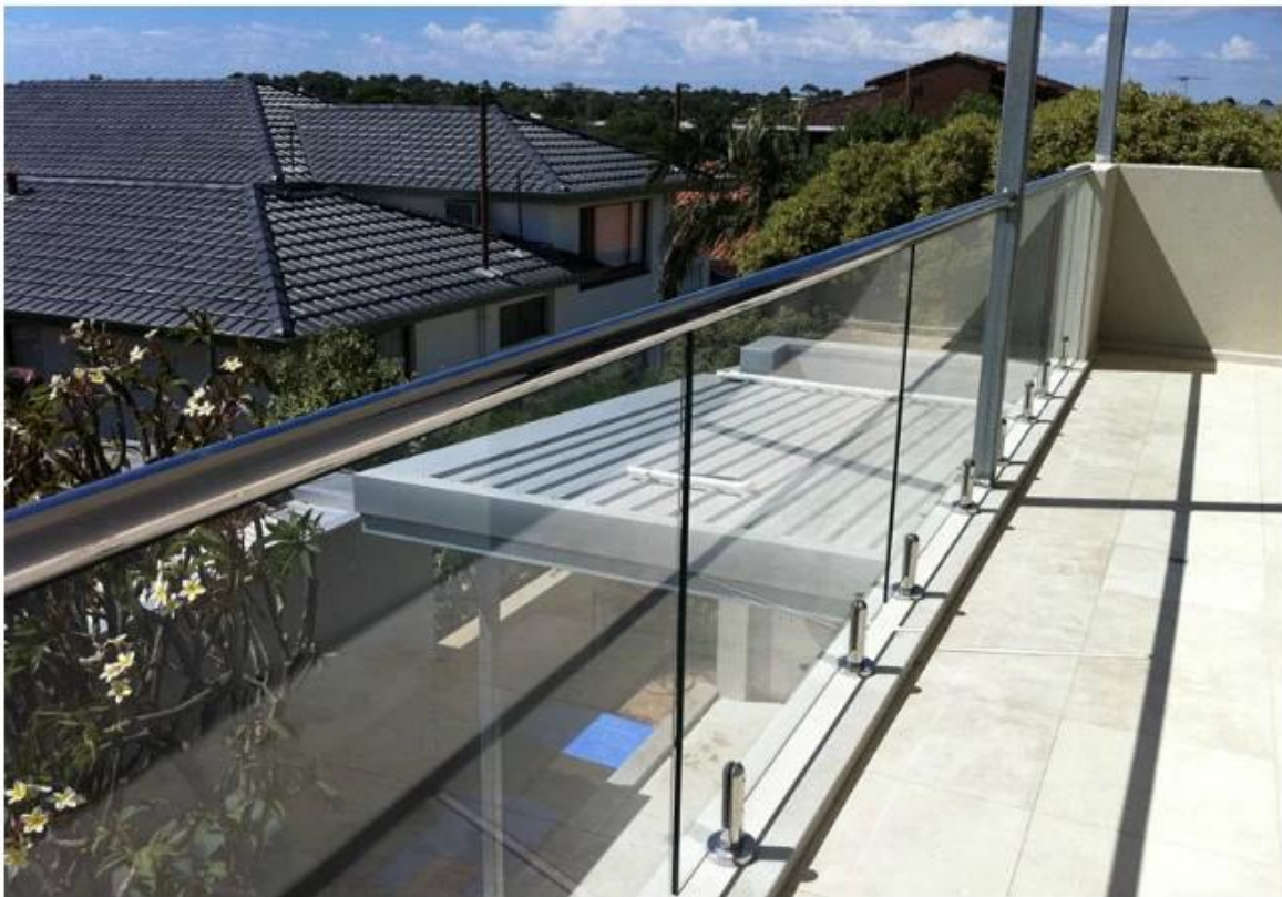
2. Stal nierdzewna Czop na basenie wzorem: