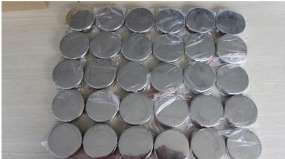
Zaślepka na szczycie słupa