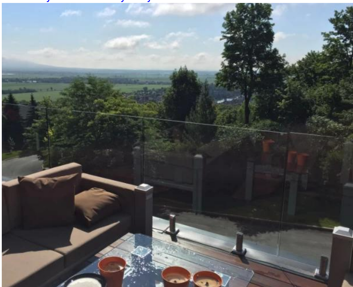
Shenzhen Launch Co., Ltd jest profesjonalną manufakturą z projektowaniem, produkcją i sprzedażą sprzętu ze stali nierdzewnej, szklanych balustrad, akcesoriów do poręczy i innych