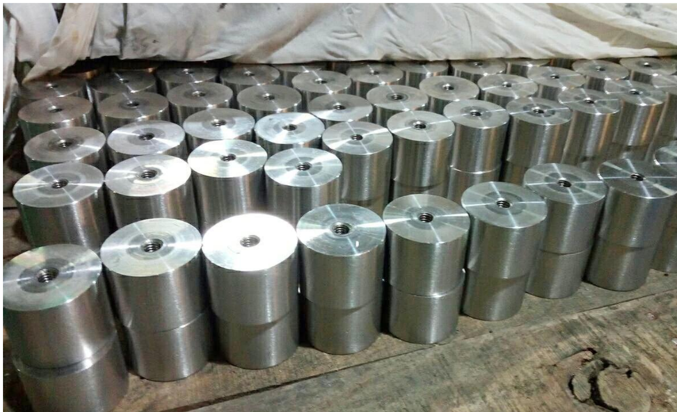
2 # Model: Średnica 50mm x 44mm Long Base Standoff