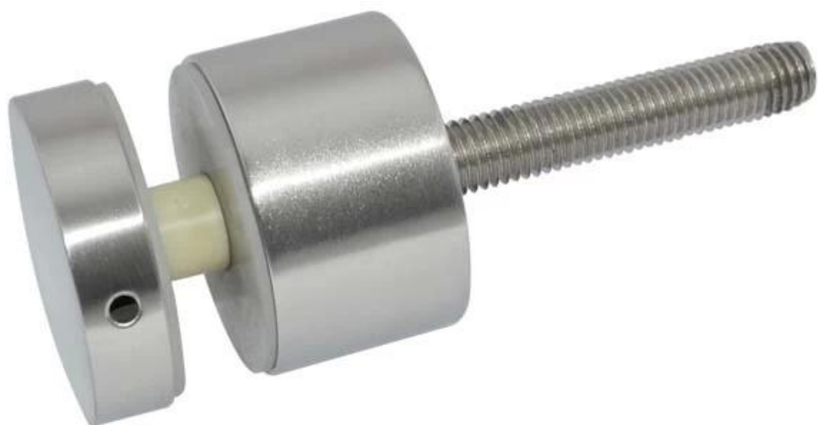
foto de Monte madeira de vidro suporte isolador suporte