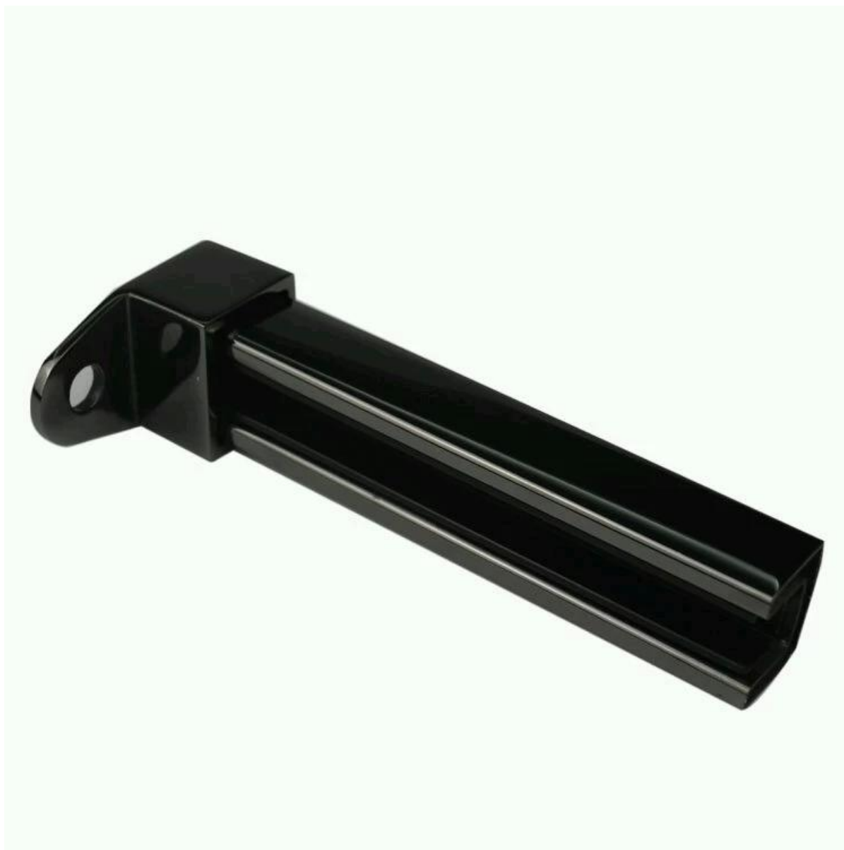
Espelho polido e escovado com acabamento em trilho de tampa quadrada de 25 mm x 21 mm,