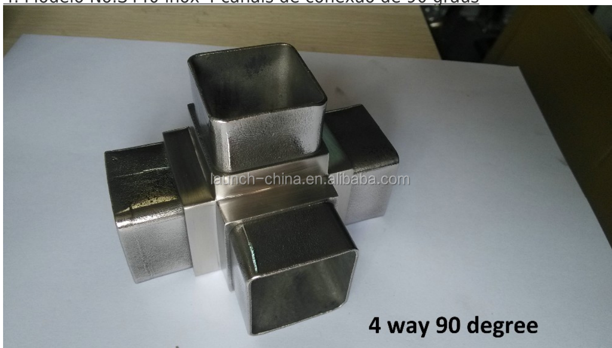
4 way 90 degree

4. Modelo No.S440 inox 4 canais de conexão de 90 graus