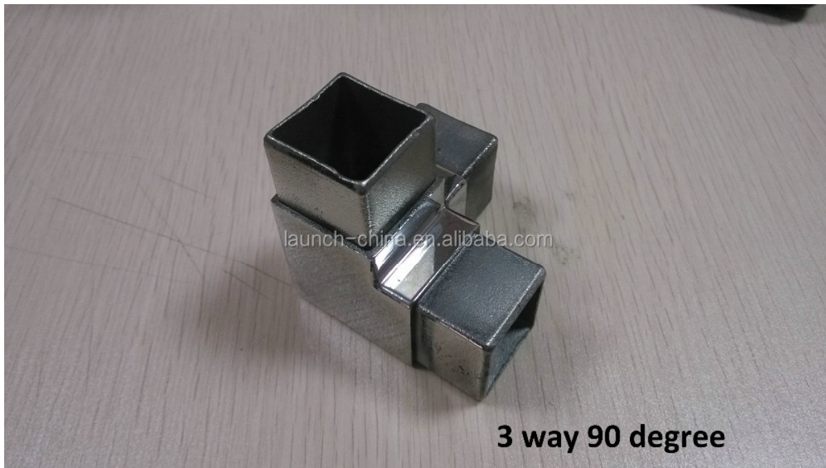
3 way 90 degree

4. Modelo No.S440 inox 4 canais de conexão de 90 graus