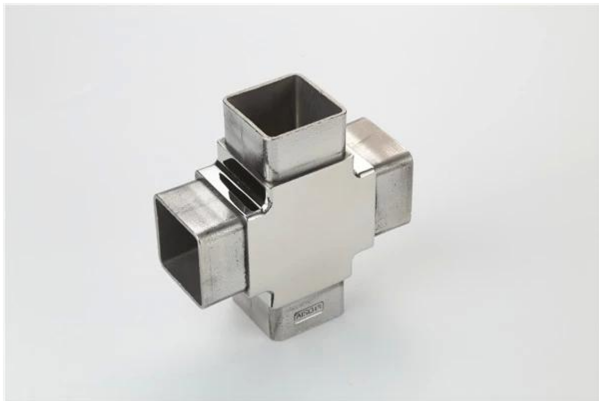
Conector de tubo 6.Rond javascript: void (0); /* 1468479229835 */