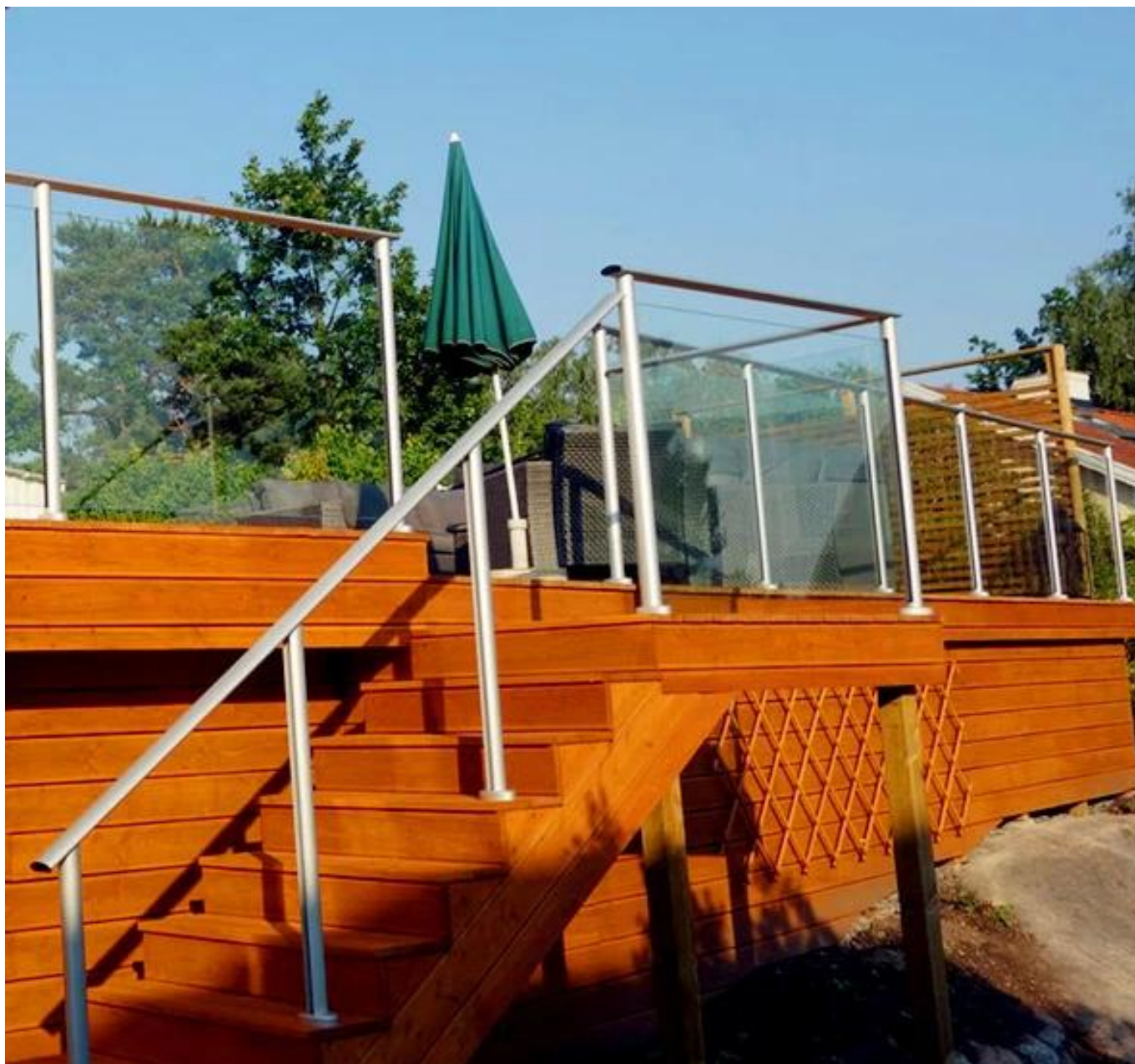
Poste de alumínio sem handrtodos