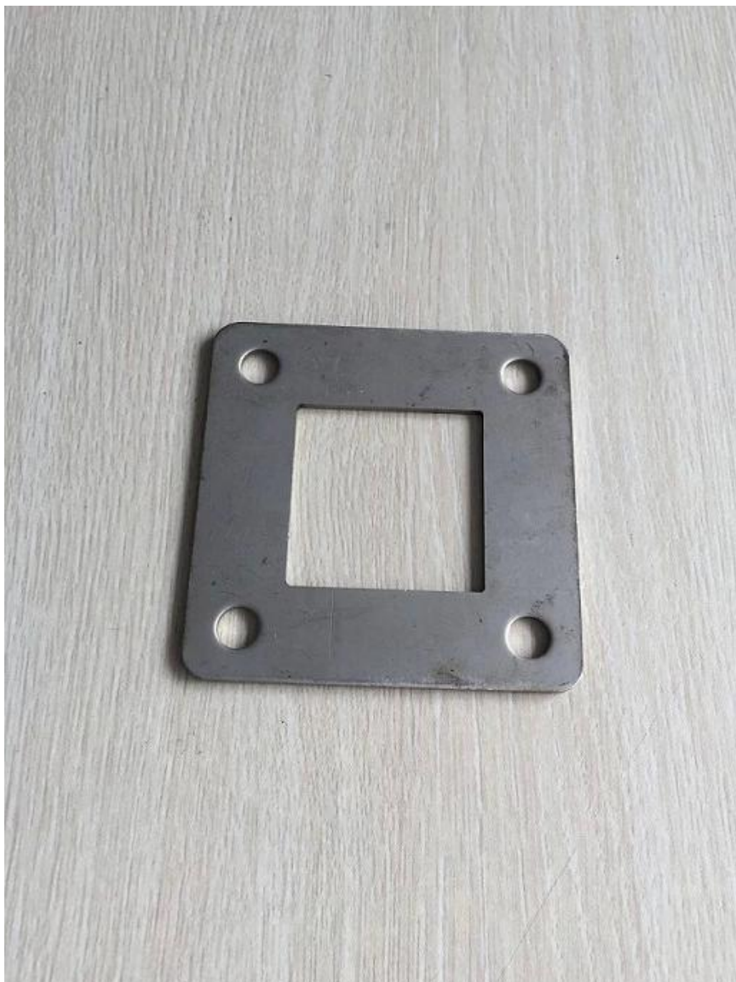
Modelo no .: CP113