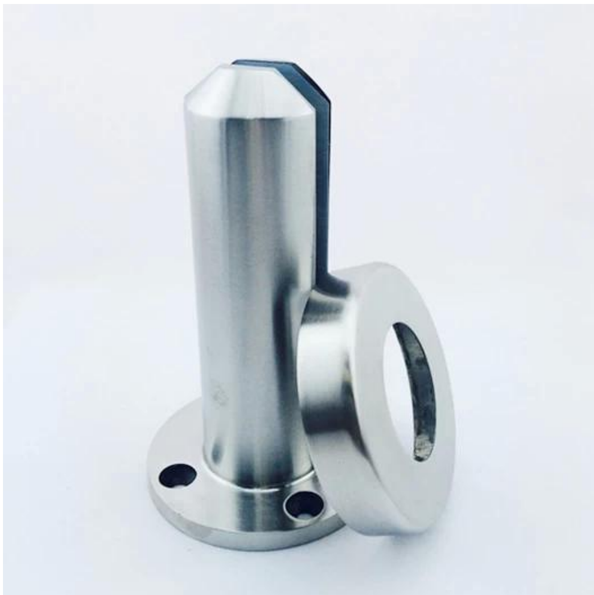
espigão de perfuração rodada do núcleo modelo no.: RCM-2