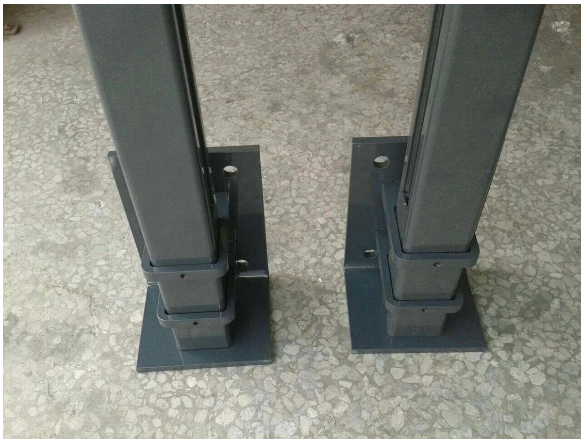
4. Aluminum foto do perfil corrimão e pós embalagem,