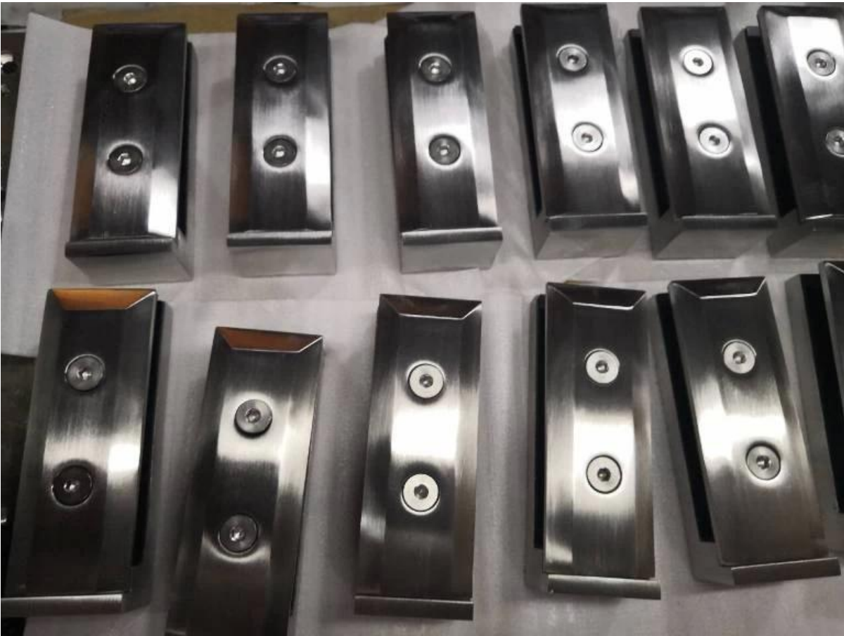
Fotos do projeto da torneira de vidro da montagem da fásia -