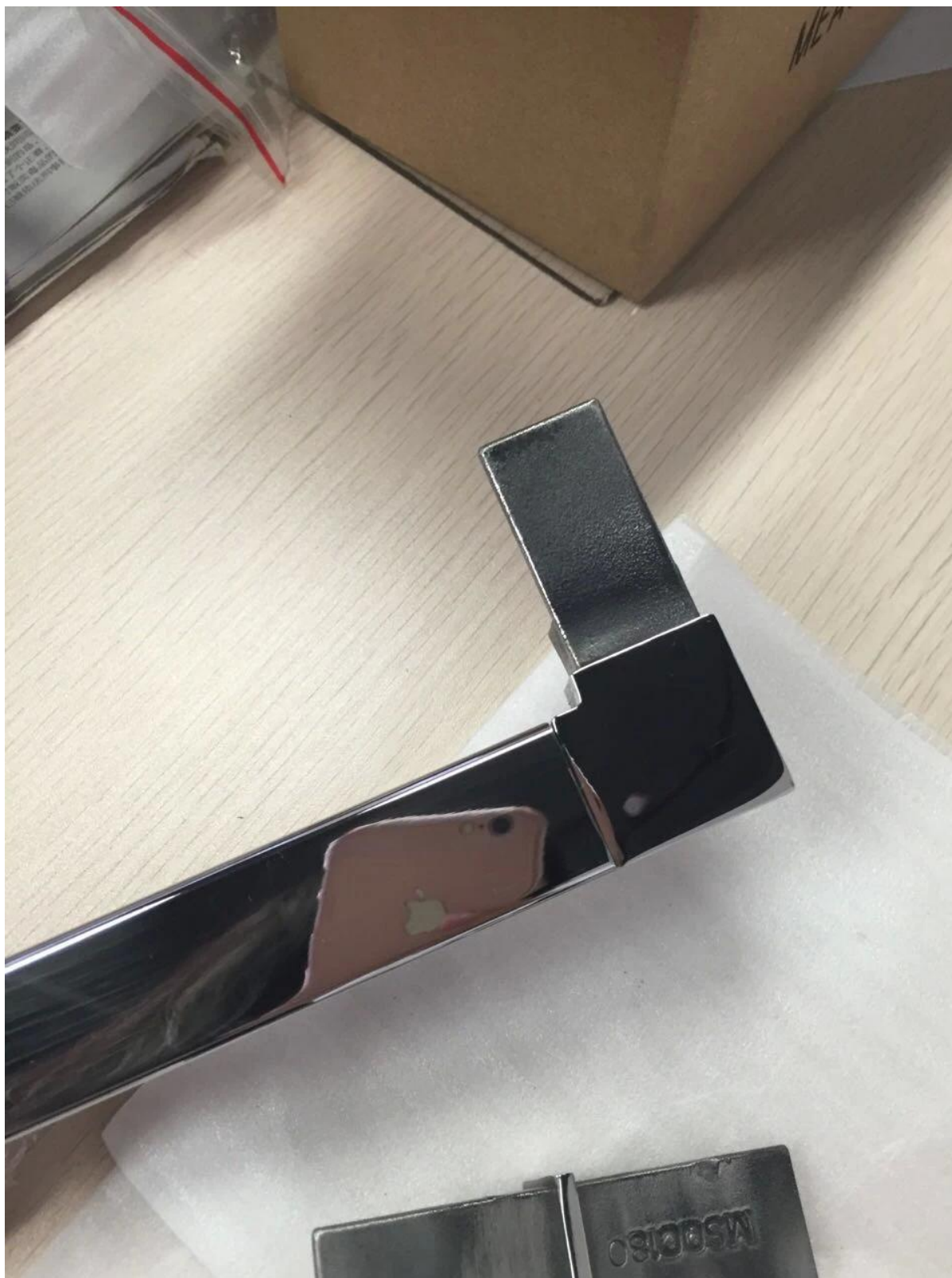
180 Grau para Aço inoxidável sulco corrimão