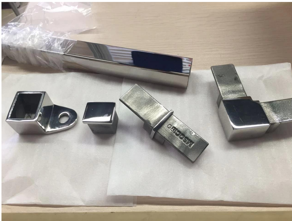
Conector ajustável para Aço inoxidável sulco corrimão