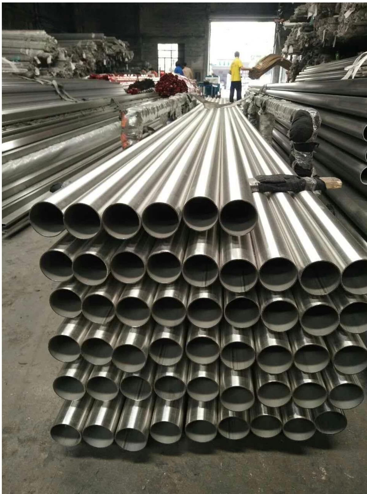
Fotos de instalação para Aço inoxidável sulco corrimento para balcão de vidro varanda