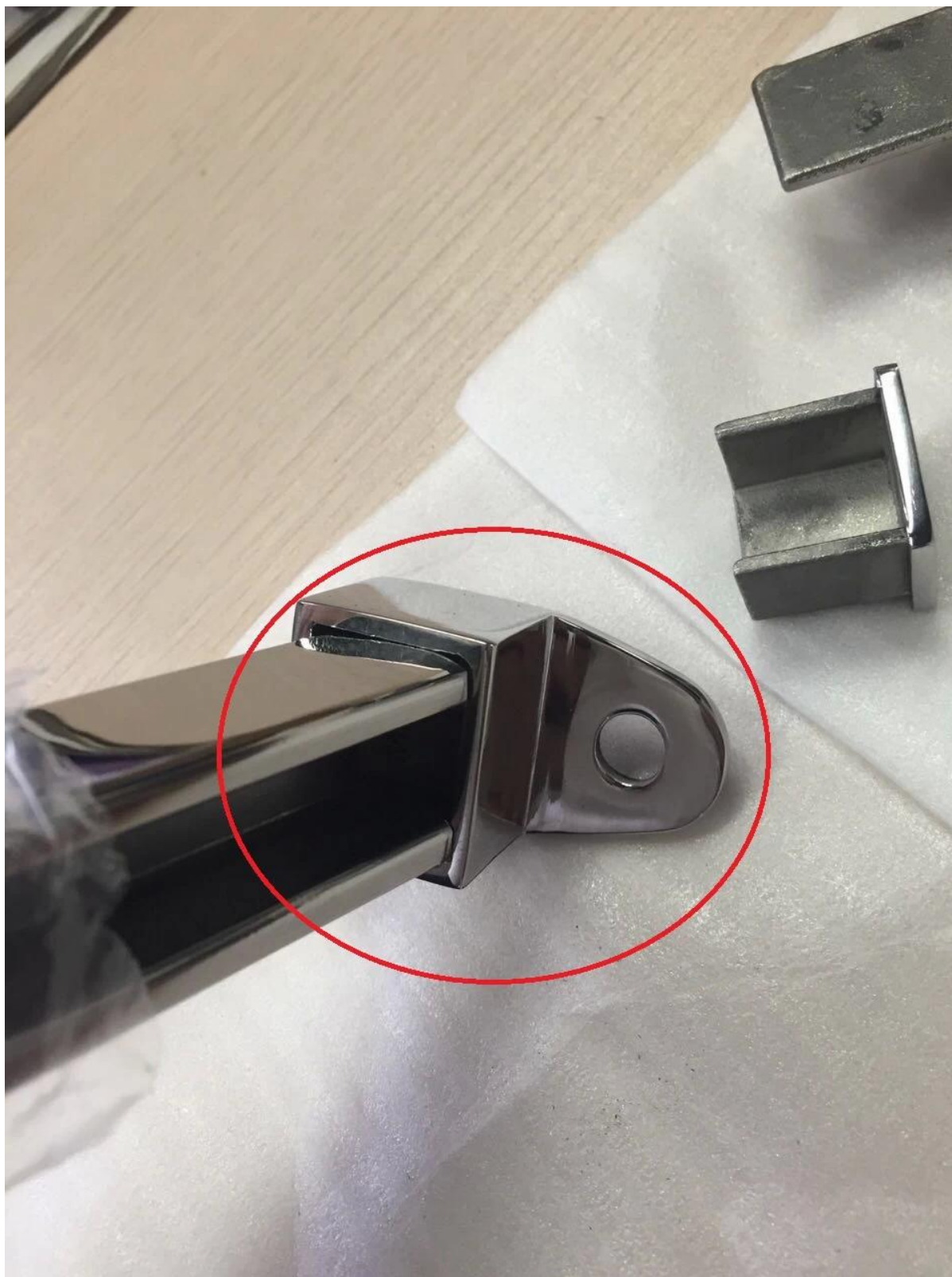
tampa de extremidade para Aço inoxidável sulco corrimão