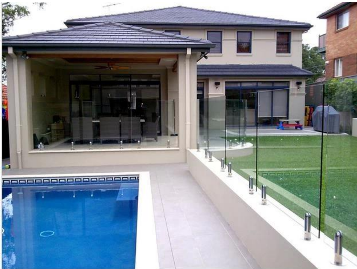
3. 4 tipos piscina cerca de natação suporte de montagem de vidro mini-postos spigot inox fotos,