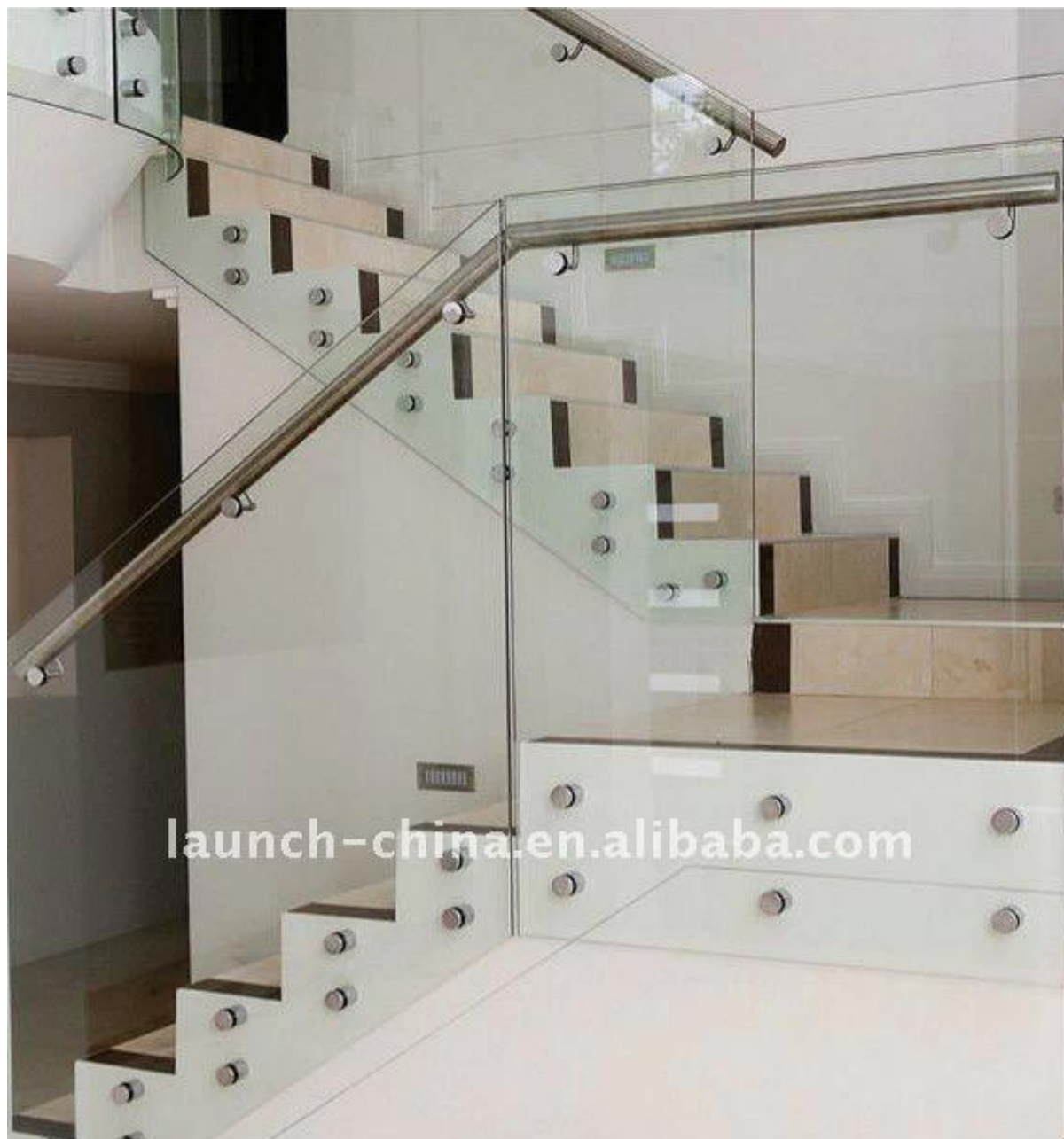
12мм закаленного стекла перила с поручнями из нержавеющей стали