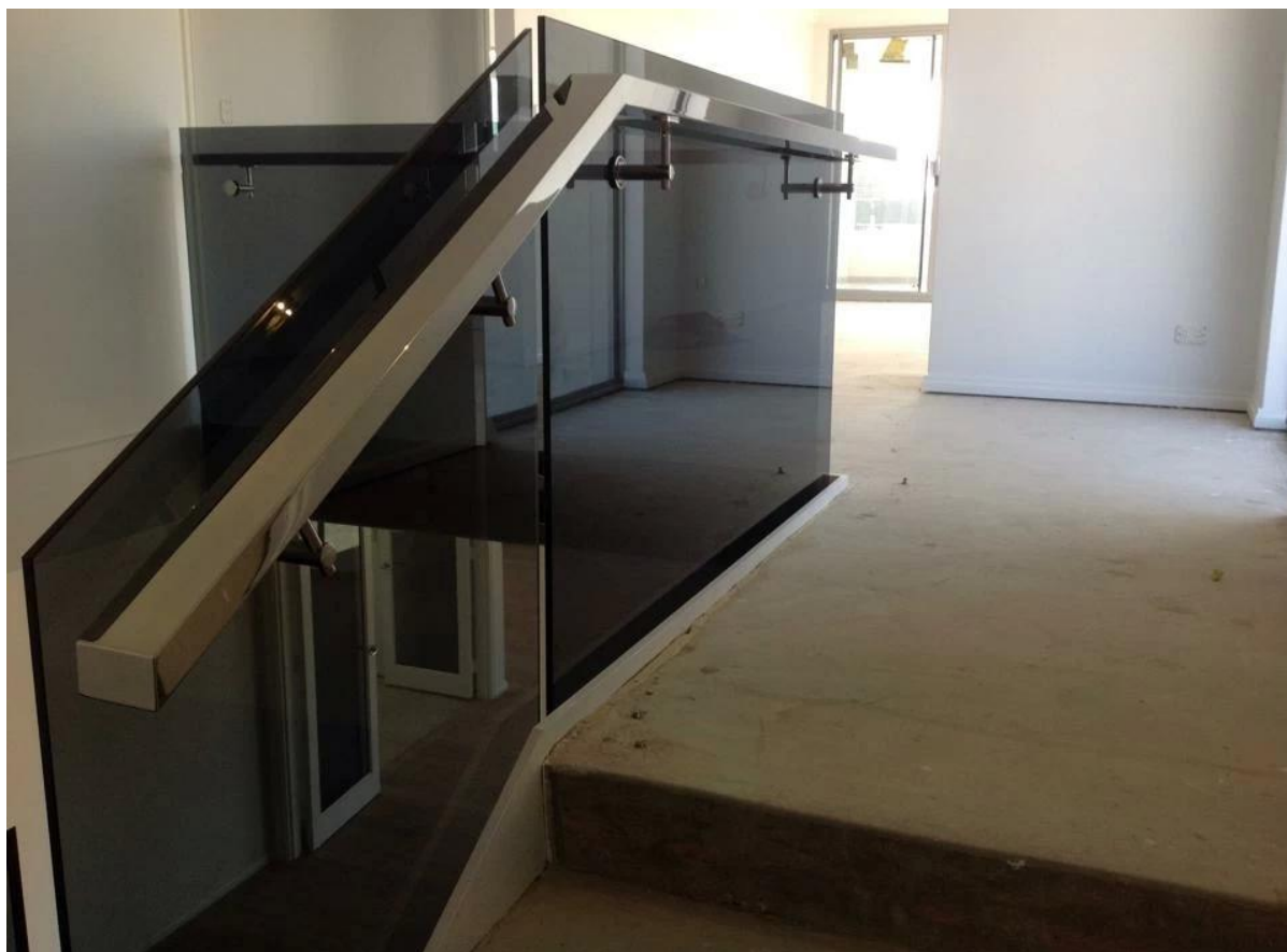
12мм закаленного стекла перила с поручнями из нержавеющей стали