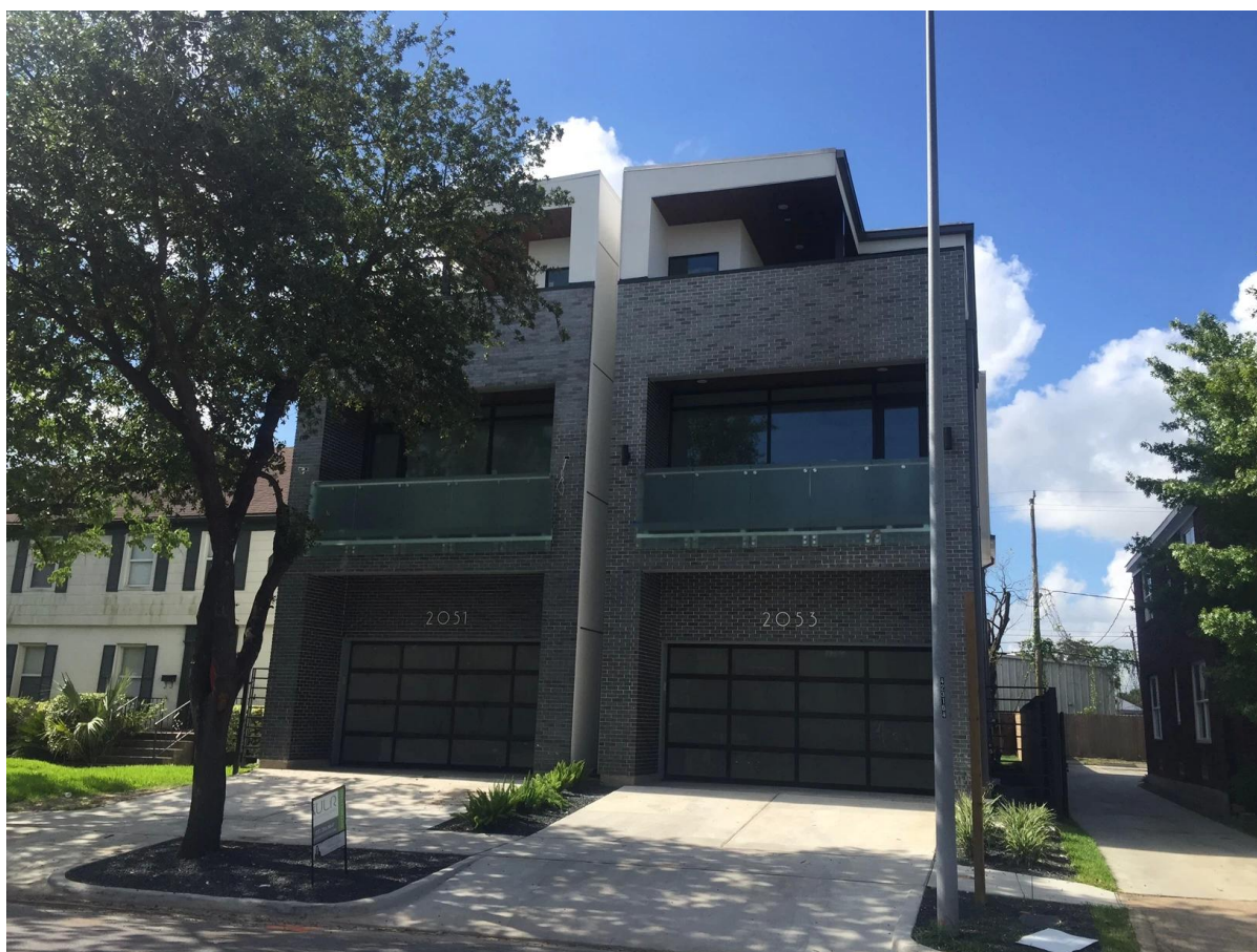
Похожие материалы - Закаленное стекло для стеклянных перил, подробнее нажмите на фото-