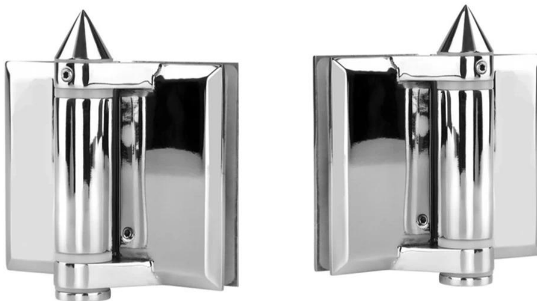
2. Стекло к стене / квадратная петля