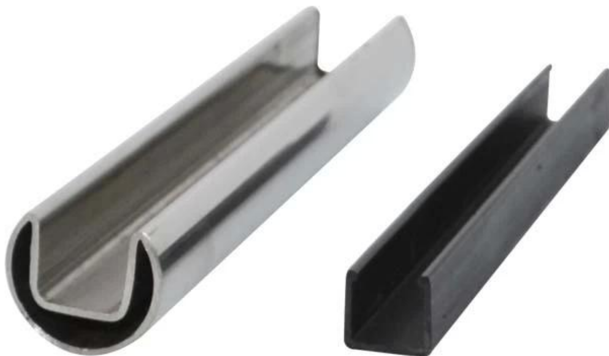
Электро-покрытие в золотом и черном цвете Круглый мини-25мм поручень из нержавеющей стали (5.8M)