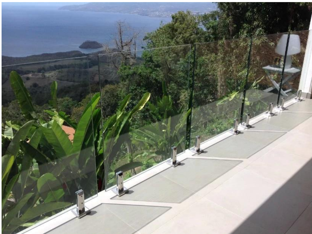
SBM в отделке сатином: