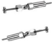
T802- 5mm/6mm cable