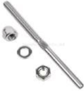
T805- 3mm cable