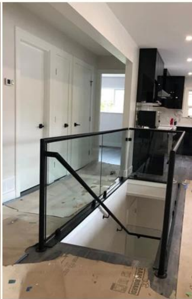
Фотографии проекта стеклянного противостояния.