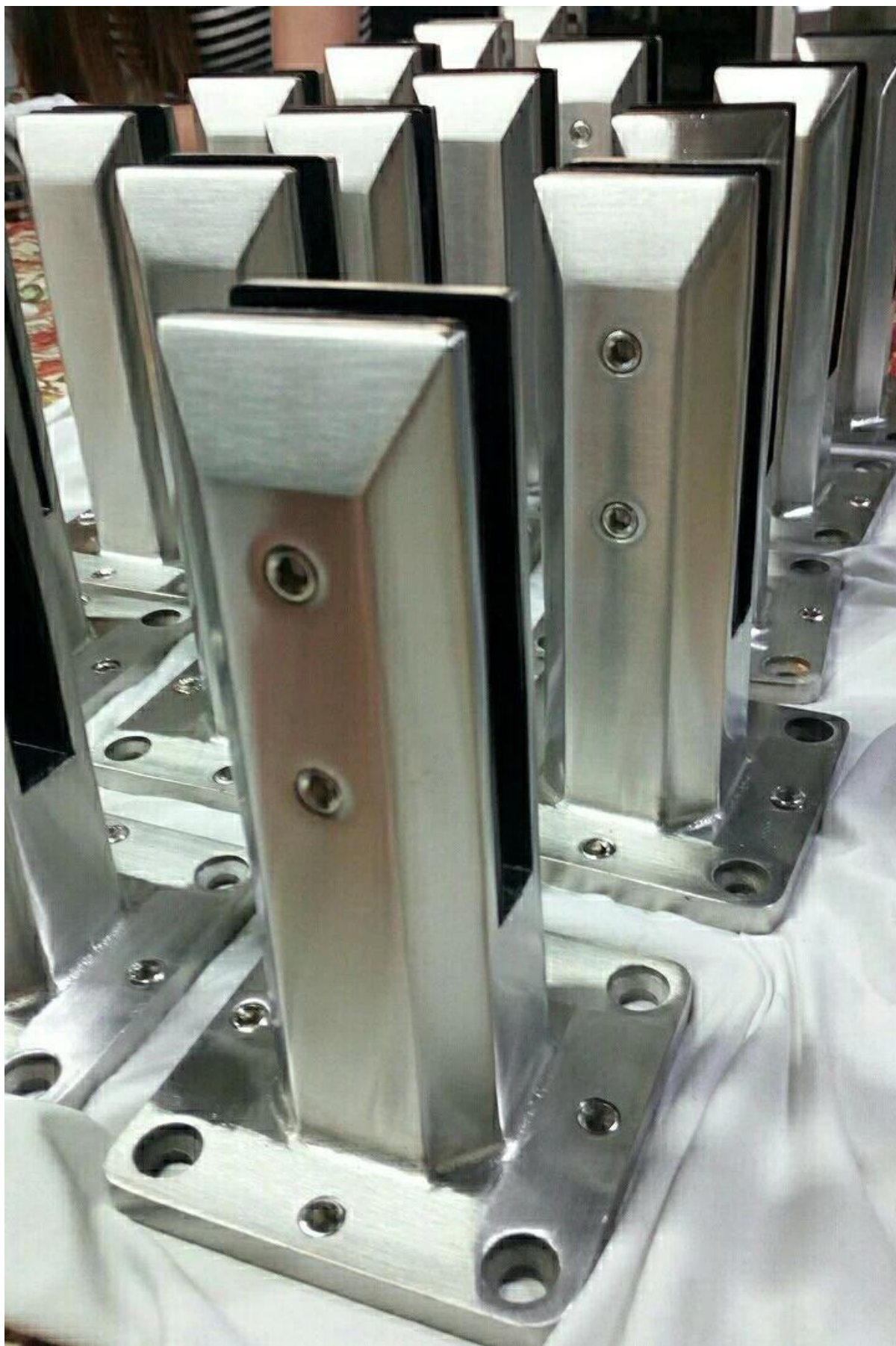
Фотографии полуфабрикатов с регулируемым балансировочным стеклом: