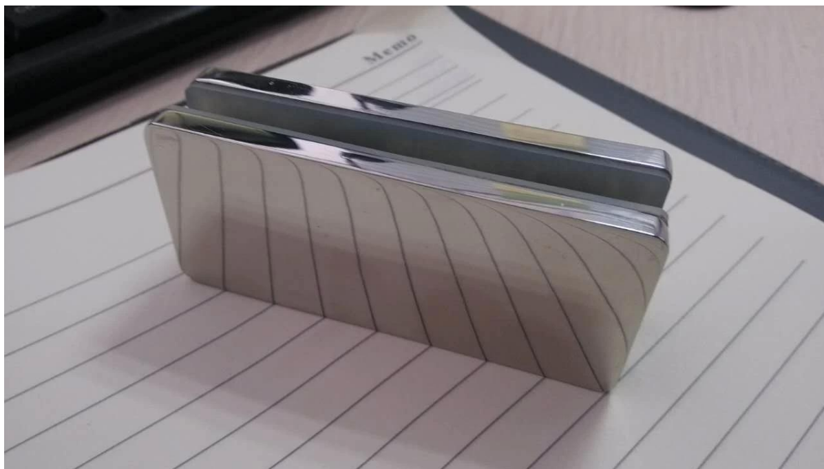
Лестница из стекла перила с противостоянием и стеклянным зажимом