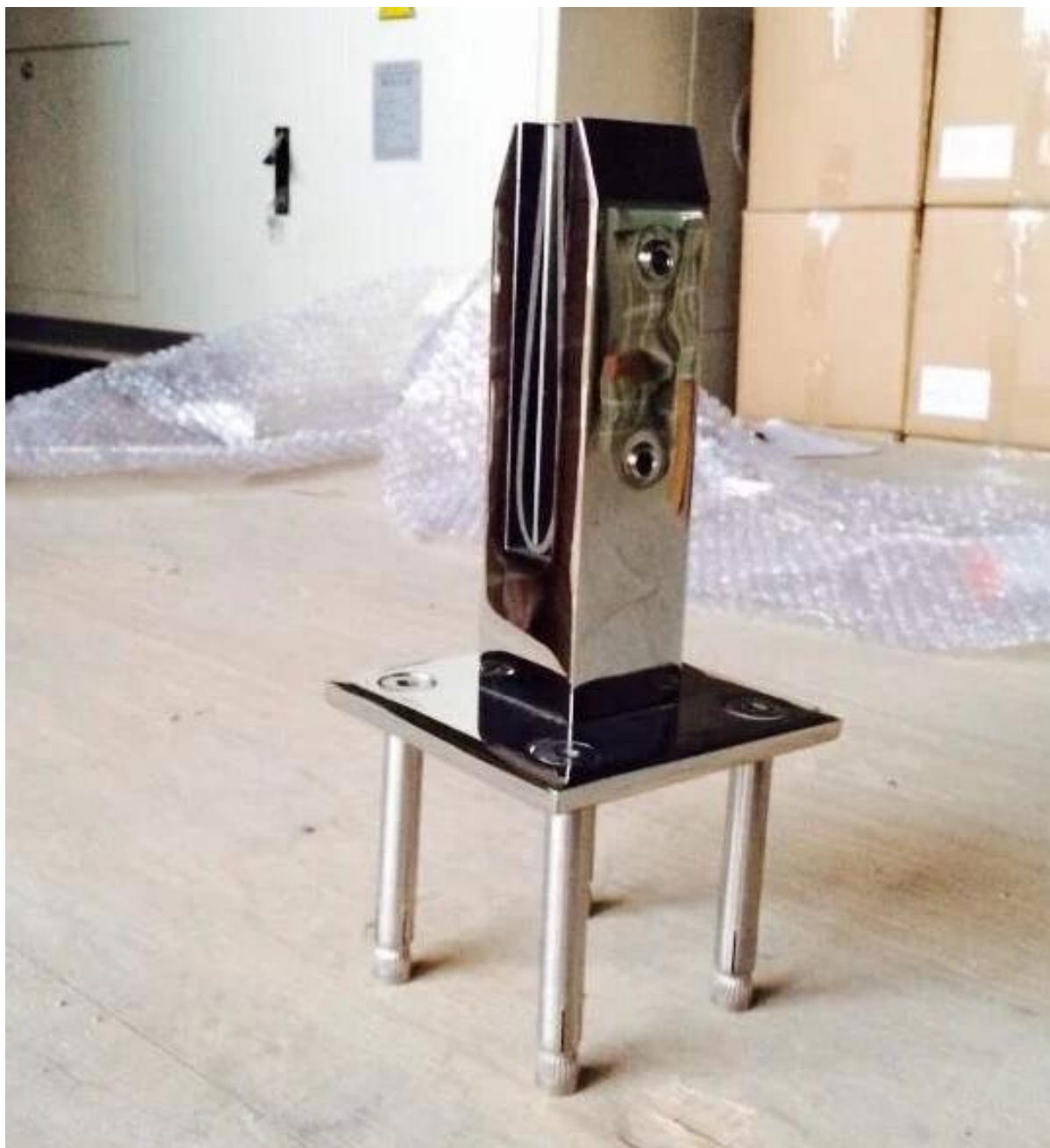
Упаковка фотографии для площади палубы смонтировать стеклянные кран 316 нержавеющей сталь