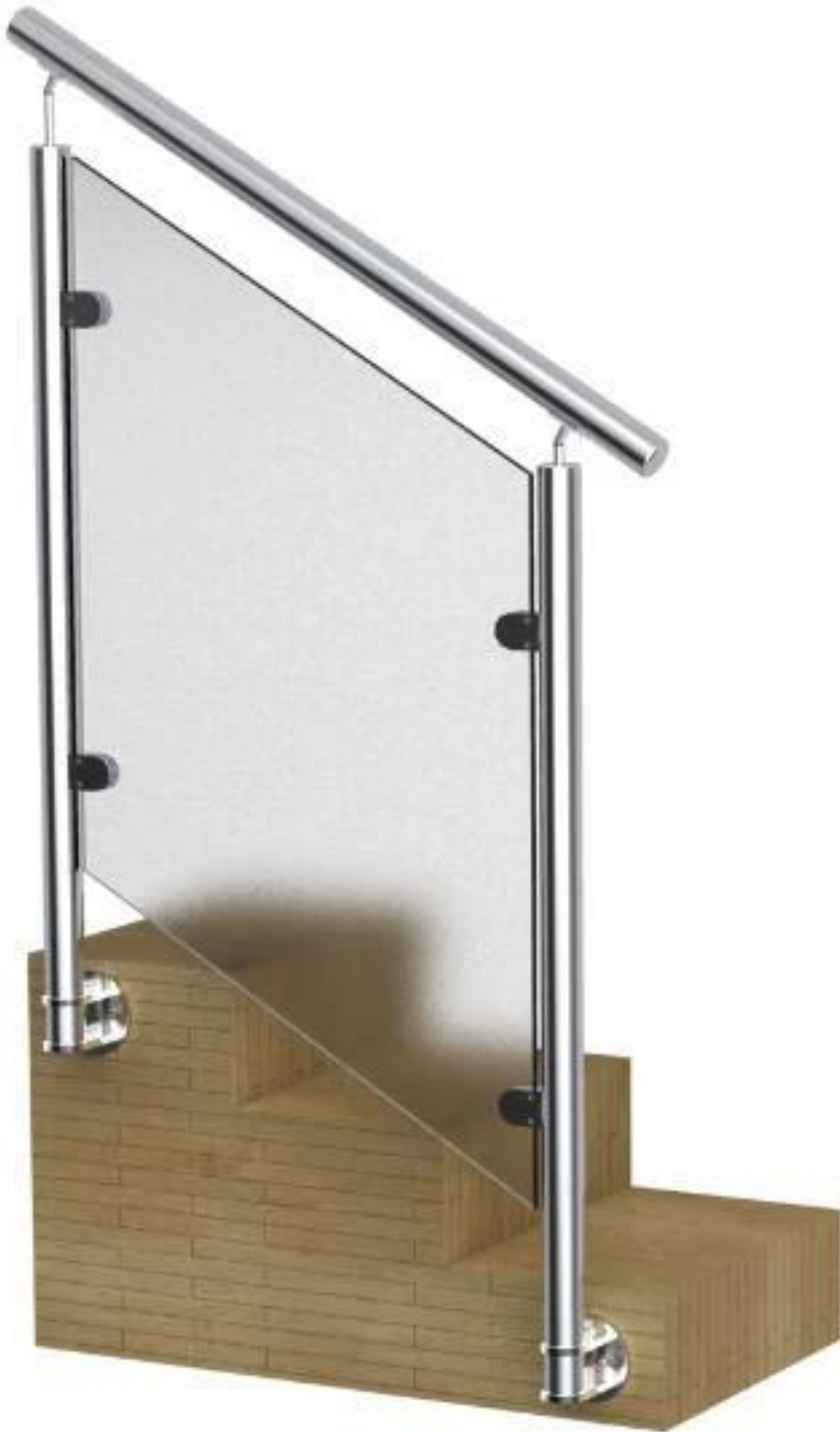
3. балюстрада из нержавеющей стали Перила из стекла палубе перила балкона проект защитное ограждение: